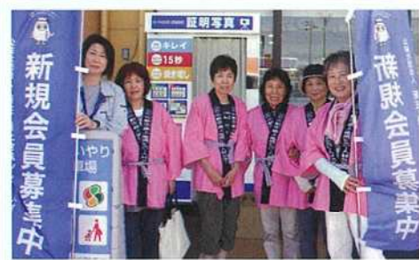
ヨークベニマル新庄下田店 H29.8.2