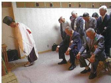
神事による「安全祈願祭」