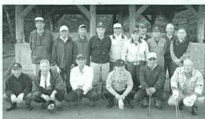
茶屋町・万場町・沼田班