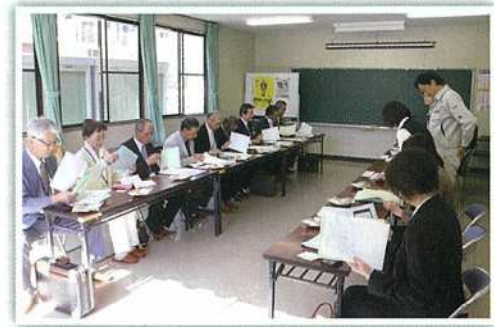
◀役員視察研修 陸前高田市シルバー H30年10月3～4日