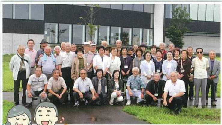
▲こぶしの会親睦旅行 石巻方面 H30年9月7日