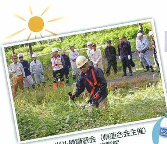
▲刈払機講習会（県連合会主催） 新庄市体育館 H30年9月28日