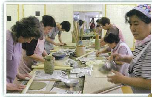
▲女性部委員会 東山焼き体験教室 H30年9月1日