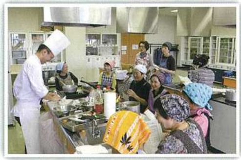
▶健康食調理講習会 新庄市民プラザ H30年9月21日