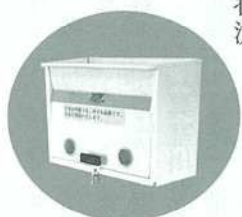
事務所正面入口に設置