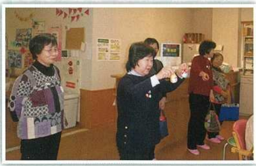
▲手づくりの会ボランティア みすぎ荘 H30年11月28日