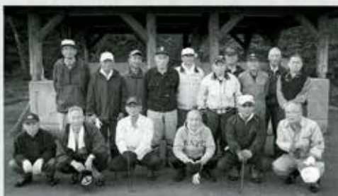
5/14 茶屋町・万場町・沼田町班による 西山河川公園清掃